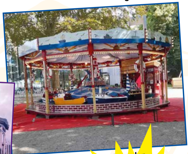
De nieuwe bootjesmolen