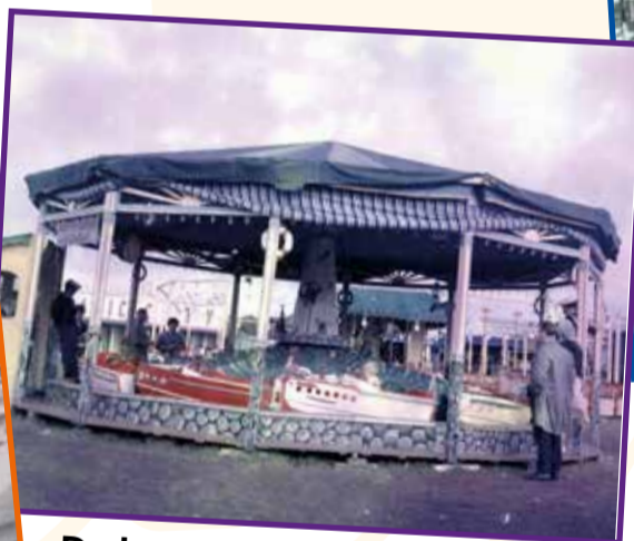
De bootjesmolen van vroeger